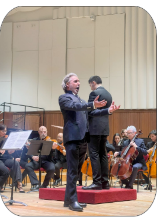
A seguire il concerto V. Fael con Oasi di malinconia